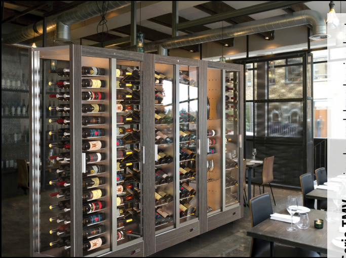
Serie TMV einzeln, modular oder eingebaut