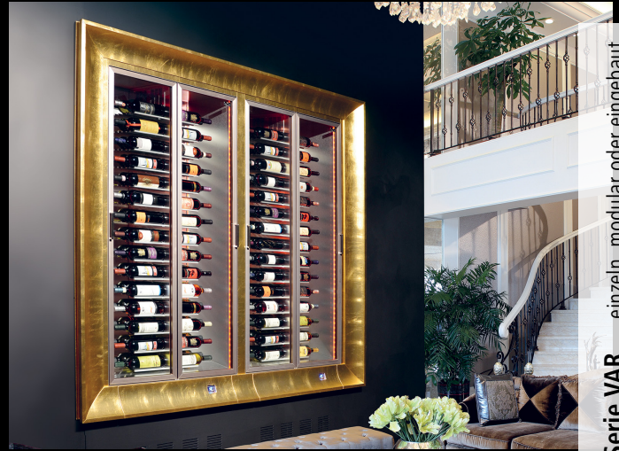
Serie VAR einzeln, modular oder eingebaut

Die professionellen Weintemperierschränke der Serien TMV und VAR sind eine Revolution in der Welt der Weinliebhaber. Mit den vielfältigen Möglichkeiten für Form und Größe, Farbe und Dekor sowie Innenausstattung lassen sie sich immer wieder zu neuen, einzigartigen Präsentationslösungen für Weinsorten aller Art konzipieren.